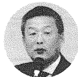
中小企業家同友会全国協議会(中同協) 経営労働委員会委員長